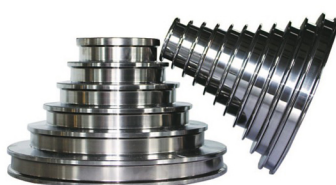
金刚线母线拉丝塔轮 (表面喷涂碳化钨或全合金真空处理)