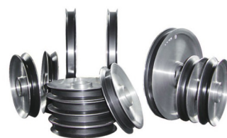
铝合金导轮 (表面喷涂陶瓷)