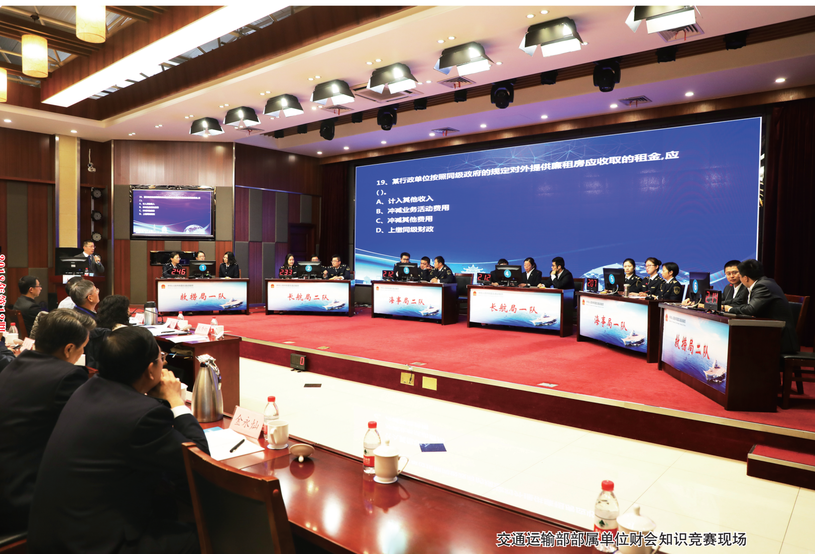
交通运输部部属单位财会知识竞赛现场

http://www.chinacas.org/ http://jtck.cbpt.cnki.net/ E-mail:jtck@chinajournal.net.cn