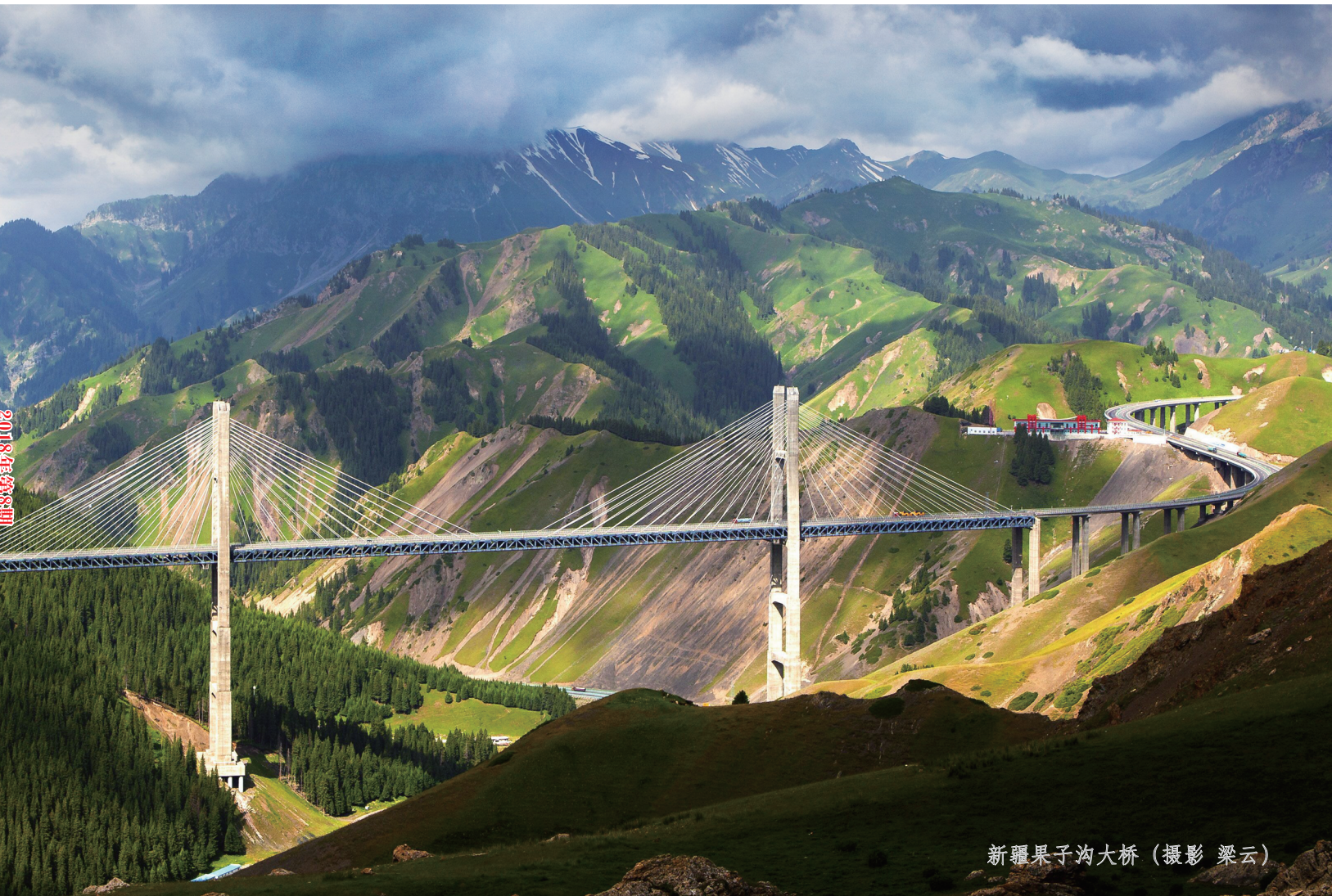
新疆果子沟大桥

http://www.chinacas.org/ http://jtck.cbpt.cnki.net/ E-mail: jtck@chinajournal.net.cn