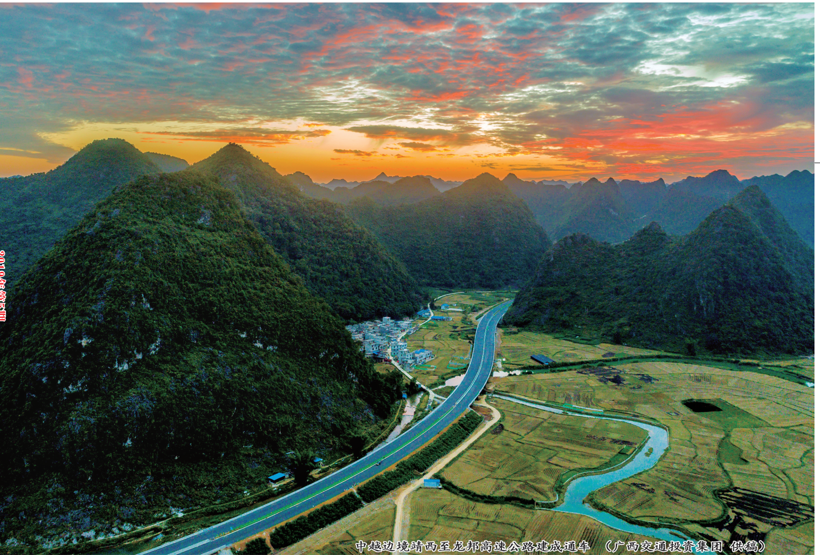
中越边境靖西至龙邦高速公路建成通车

http://www.chinacas.org/ http://jtck.cbpt.cnki.net/ E-mail:jtck@chinajournal.net.cn