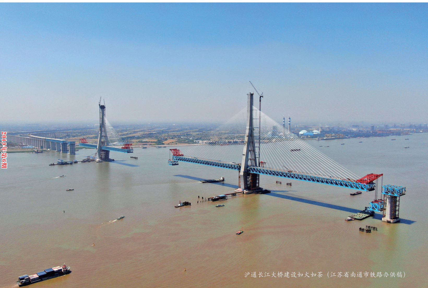
沪通长江大桥建设如火如荼

http://www.chinacas.org/ http://jtck.cbpt.cnki.net/ E-mail:jtck@chinajournal.net.cn