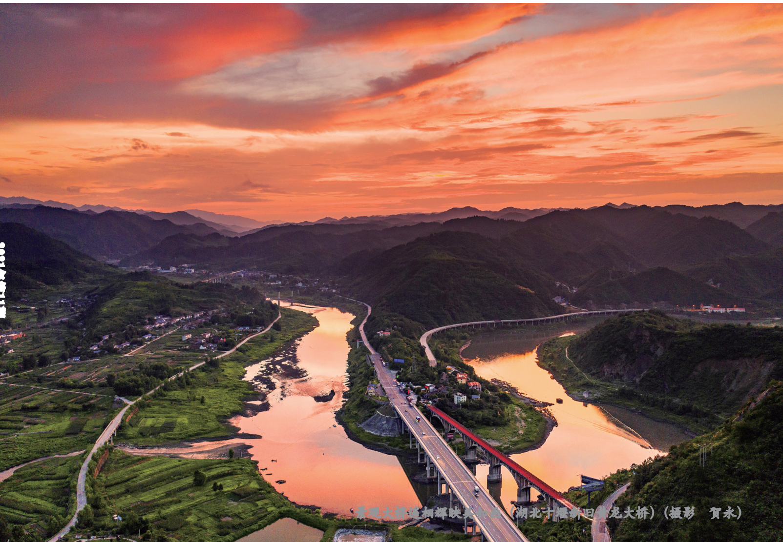
景观大桥道相辉映映美如画 (湖北十堰新回龙大桥)

http://www.chinacas.org/ http://jtck.cbpt.cnki.net/ E-mail: jtck@chinajournal.net.cn 万方数据