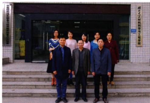
功能薄膜与涂层材料