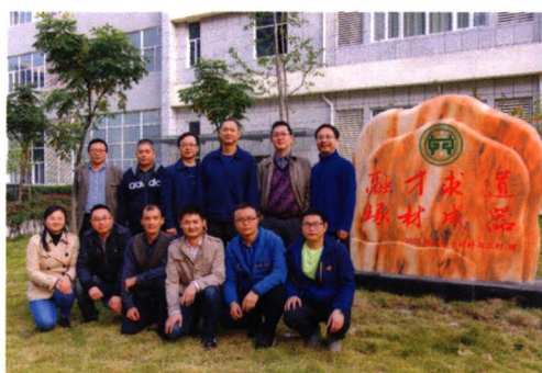
高性能高分子合金