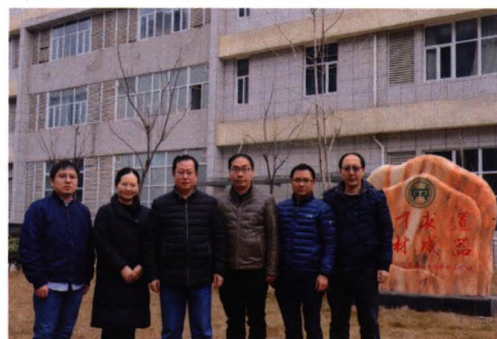
纳米能源材料与器件