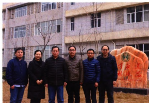
纳米能源材料与器件