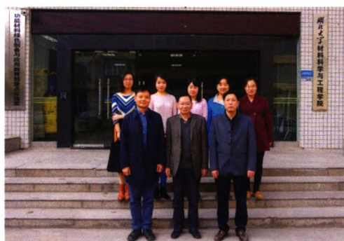
功能薄膜与涂层材料