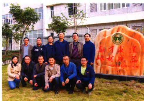
高性能高分子合金