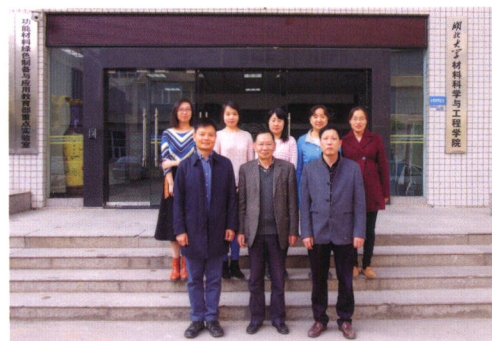
功能薄膜与涂层材料