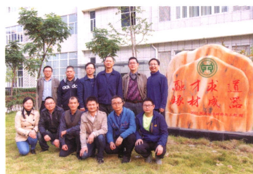
高性能高分子合金