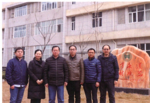
纳米能源材料与器件