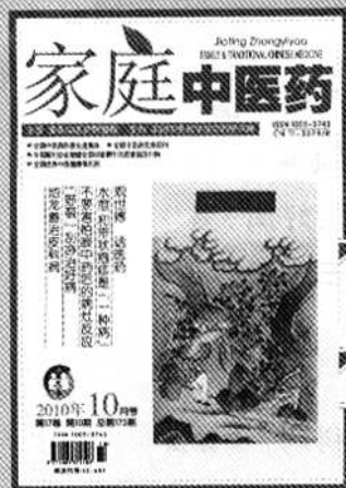
封面图出自《补遗雷公地制便览》

主管 国家中医药管理局 主办 中国中医科学院中药研究所 (地址:北京东直门内南小街16号) 编辑出版 《家庭中医药》杂志社编辑部 社长 李国坤 主编 张瑞贤 责任编辑 李国坤 美术编辑 刘建辉 创刊日期 1993年12月 出版日期 2010年10月8日 地址 北京东直门内南小街16号 邮编 100700 电话 010-64052170/64014411-2985 E-mail jtzy@126.com 博客地址 http://blog.sina.com.cn/jtzy ISSN 1005-3743 中国标准连续出版物号 CN 11-3379/R 广告许可证 京东工商广字第0029号 总发行 北京市报刊发行局 国内订阅处 全国各地邮局 邮局订阅代号 82-654 定价 5.50元 国外总发行 中国国际图书贸易总公司(北京399信箱) 国外代号 M1309 印刷 北京市百善印刷厂 (《家庭中医药》杂志手机版,由Goonews手机新媒体平台提供技术支持。