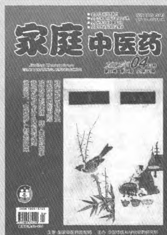
封面图出自《补遗雷公炮制便览》