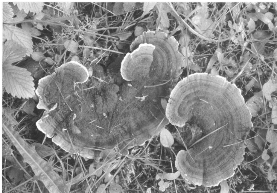
Onnia tomentosa (Fr.) P. Karst.

Basidiomycota Agaricomycetes Hymenochaetales Hymenochaetaceae