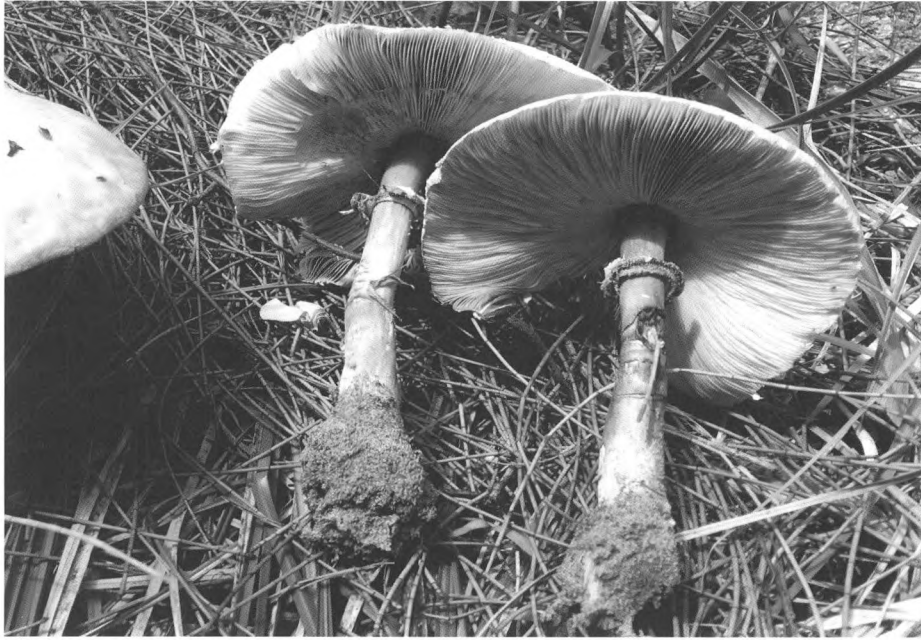
Chlorophyllum molybdites (G. Mey.) Masseé

Basidiomycota Agaricomycetes Agaricales Agaricaceae