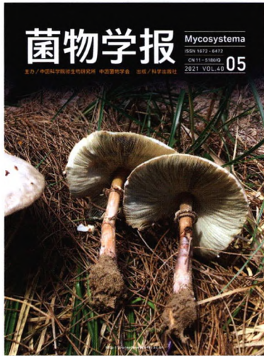
第40卷 第5期 (总第215期) 2021年5月22日 (月刊)

《菌物学报》(英文刊名Mycosystema)的前身为《真菌学报》，1982年创刊，是中国科学院主管的我国自然科学核心期刊。主要报道菌物(真菌、粘菌、卵菌等)学研究领域的最新成果，包括菌物系统分类学、菌物分子与细胞生物学、菌物区系地理学、菌物多样性及资源开发利用、动植物病原菌物学、医学真菌学、食用和药用真菌学等方面的综述、研究论文及简报。