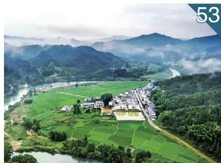
53 铜鼓：改善人居环境 建设美丽乡村

走在时代潮头，江西将坚持设施化发展方向不动摇，高质量建设蔬菜基地、大力度培育职业菜农、全链条开展服务指导、多渠道搭建销售平台，坚决完成蔬菜产业高质量发展三年行动计划，全面推动蔬菜产业全产业链高质量发展，加快打造新时代乡村振兴样板之地。