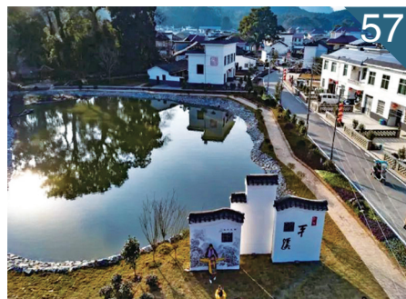
57 宜丰：打造美丽乡村 共享美好生活