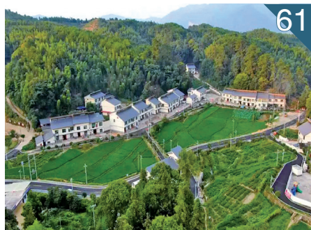
61 万载槽岭：红色名村精彩“蝶变”