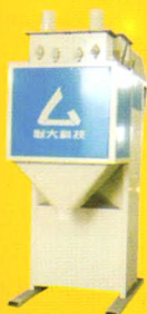
双斗式小包装快速包装秤