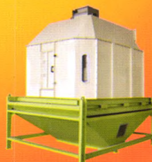
SKLN系列逆流式冷却器