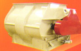
SLHJ系列双轴高效混合机