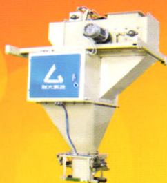
皮带式快速定量包装秤