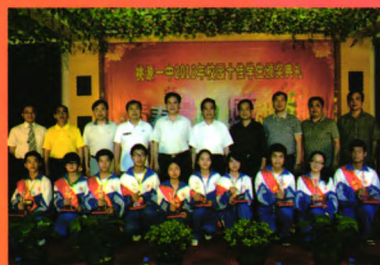
校园十佳学生颁奖典礼