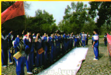
“知我桃源，爱我桃源”主题德育实践活动