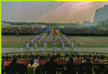
万方数据9届运动会