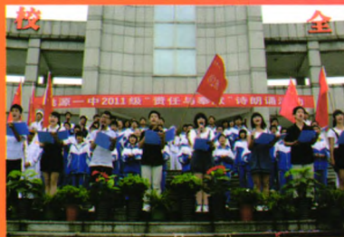
“责任与奉献”诗朗诵活动