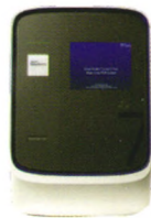
Applied Biosystems™ QuantStudio™ 7Flex Real-Time PCR System