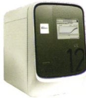
Applied Biosystems™ QuantStudio™ 12K Flex Real-Time PCR System