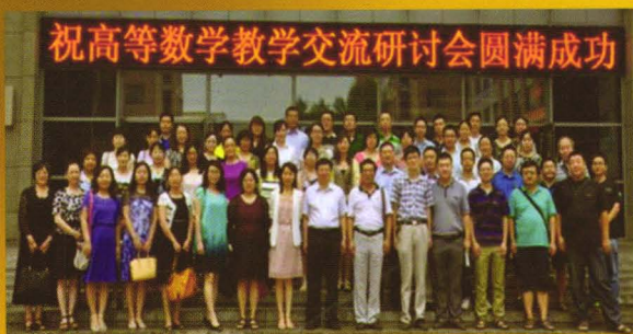
高等数学教学交流研讨会

哈尔滨工业大学教师教学发展中心为国家级教师教学发展示范中心，隶属于哈尔滨工业大学本科生院，由主管教学副校长兼任中心主任。中心设有专家委员会、工作指导委员会、办公室、分中心及“丁香园”青年教师教学发展联合会，构建了专兼职相结合、多学科专家与管理者相结合的专业化团队，汇聚了一批著名学者、教学名师作为中心工作的强大智库，形成了顶层设计、统筹规划、协同联动的组织机构。