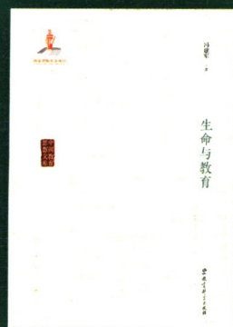
《生命与教育》 冯建军/著