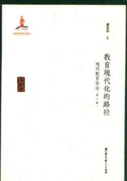
《教育现代化的路径》 褚宏启/著