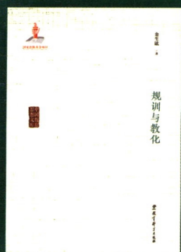
《规训与教化》 金生铉/著