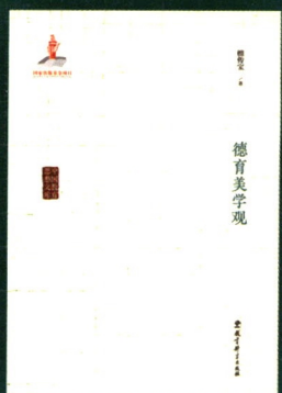
《德育美学观》 檀传宝/著