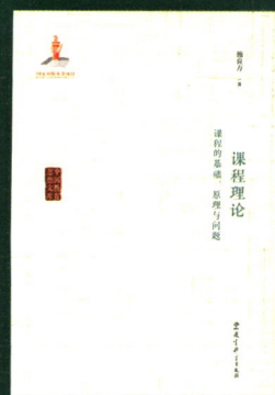
《课程理论》 施良方/著