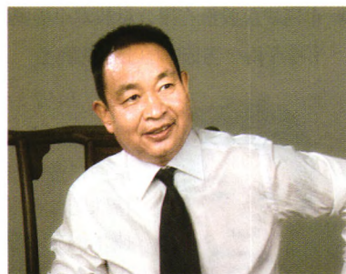
人物 FIGURE 55 奋斗改变命运