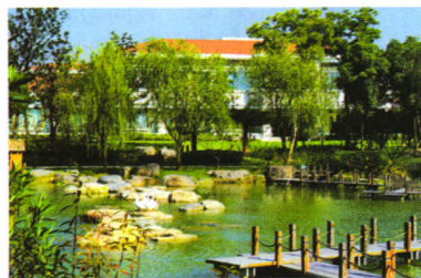
企业 ENTERPRISE 42 南通四建苏州总部：市场与城市共成长