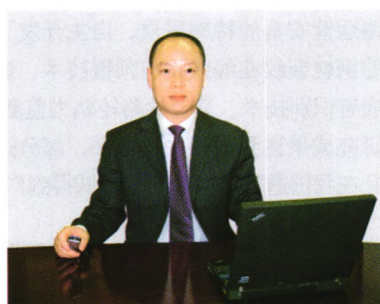
观点 VIEWPOINT 26 区域化运营——建筑企业快速成长的有效模式