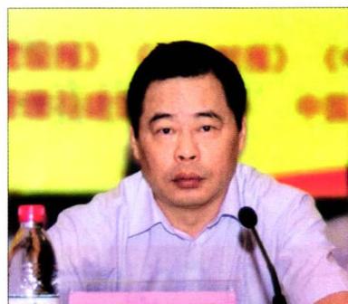
13 张 毅：全面排查 严厉打击转包挂靠等违法行为