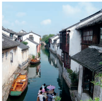
P 56 梦里水乡