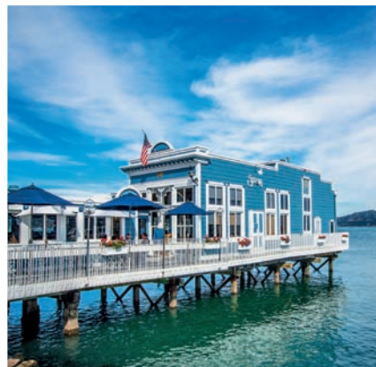
P 63 美国的船屋潮流