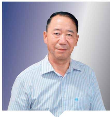
P 50 “创优专业户”炼成记