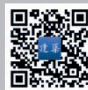
手机扫一扫，即可 下载阅读建筑资讯