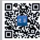
手机扫一扫，即可 下载阅读建筑资讯