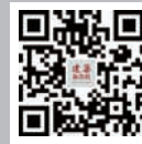
建筑杂志社 微博二维码