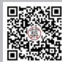
建筑观察 微信公众号