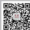
建筑杂志社 微信公众号