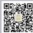
建设视野 微信公众号