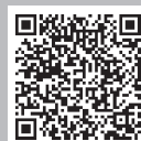
《建筑》邮局微信 订刊二维码