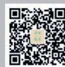
建设视野 微信公众号