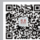
建筑杂志社 微信公众号