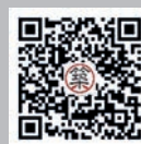
建筑观筑 微信公众号