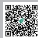
《建筑》邮局微信 订刊二维码