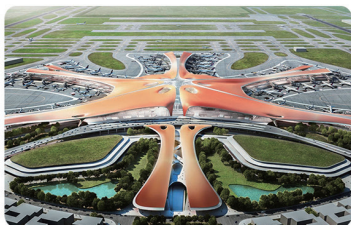
北京大兴国际机场