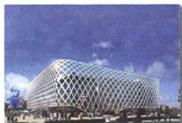
上海世博会-法国馆