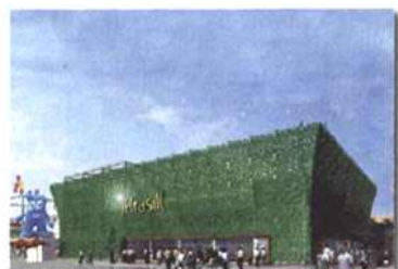
上海世博会-巴西馆