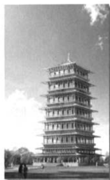
西安世园会-长安塔