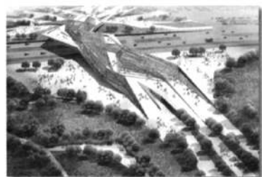
西安世园会-广运门