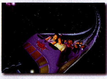
飞越太空山 (中国香港)