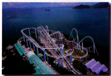
疯狂过山车 (中国香港)

全国优秀科技期刊 中国期刊方阵双效期刊 中国期刊全文数据库收录期刊 中国核心期刊(遴选)数据库收录期刊 中国科技期刊引文数据库来源期刊