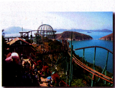
越矿飞车 (中国香港)