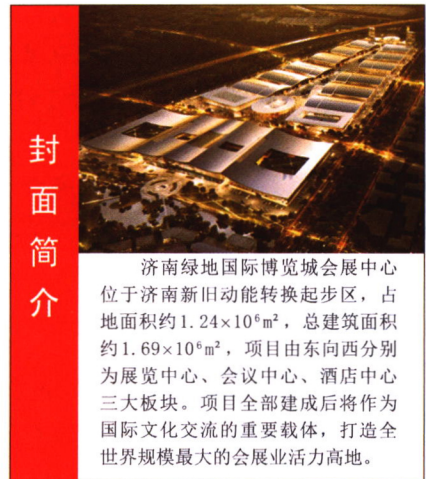
济南绿地国际博览城会展中心 位于济南新旧动能转换起步区, 占 地面积约 1.24 \times 10^6 \text{m}^2 , 总建筑面积 约 1.69 \times 10^6 \text{m}^2 , 项目由东向西分别 为展览中心、会议中心、酒店中心 三大板块。项目全部建成后将作为 国际文化交流的重要载体, 打造全 世界规模最大的会展业活力高地。

全国优秀科技期刊 中国学术期刊 (光盘版) 电子杂志社收录 期刊 中文科技期刊数据库收录期刊 中国核心期刊 (遴选) 数据库收录期刊 JST 日本科学技术振兴机构数据库 (日) 2018