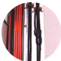
建筑电气竖井 配电应用

用于工业和民用建筑、铁路隧道、公路隧道、地铁、管廊、路灯、景观灯 低压配电系统阻燃、耐火和矿物质绝缘耐火电缆中间分支连接。