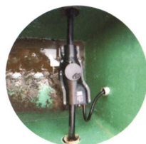
路灯/景观灯 配电应用