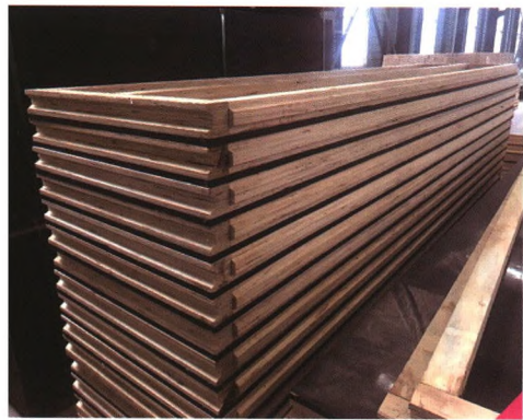
装配可拆式钢筋桁架楼承板

优点：设计→生产→预装→编号→拆模→发送到工地现场，环环相扣，预拼装只需要4~5天时间即可完成，发送到工地后施工简单，减少技术工种，大大节省了成本。