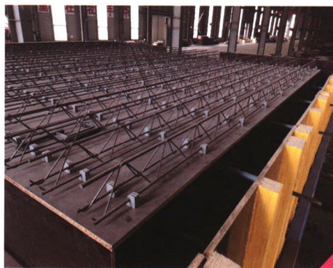
装配式可拆卸钢筋桁架楼承板