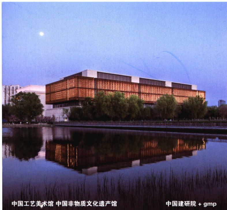
中国工艺美术馆 中国非物质文化遗产馆

No.30 North Third Ring Road East, Chaoyang District, Beijing, China, 100013