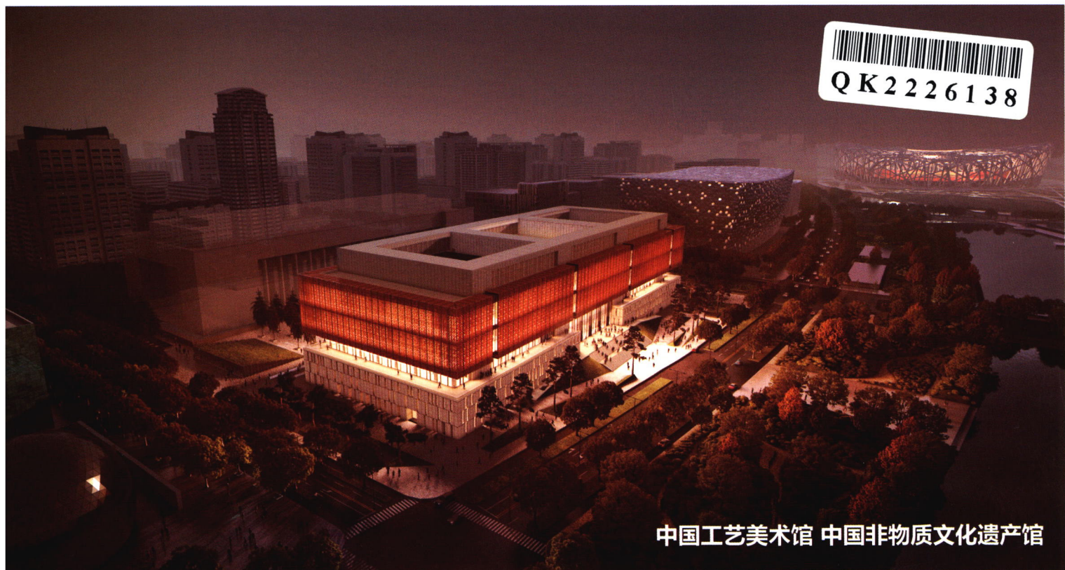
中国工艺美术馆 中国非物质文化遗产馆