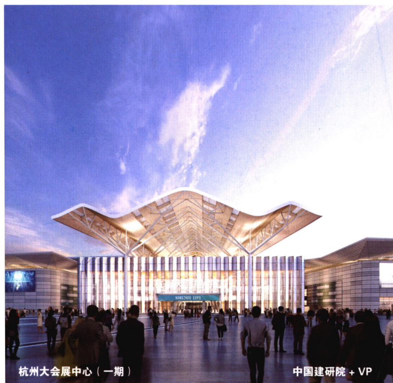
杭州大会展中心（一期）