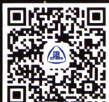
杭州大会展中心(一期)