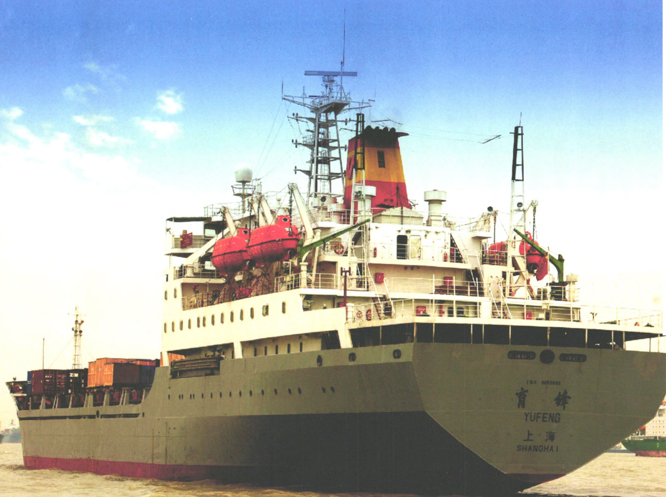
“育锋”号集装箱教学实习船

上海海事大学是一所以航运、物流、海洋为特色，具有工学、管理学、经济学、法学、文学和理学等学科门类的多科性大学。学校致力于培养国家航运业所需要的各级各类专门人才，已向全国港航企事业单位及政府部门输送了大量毕业生，被誉为“高级航运人才的摇篮”。