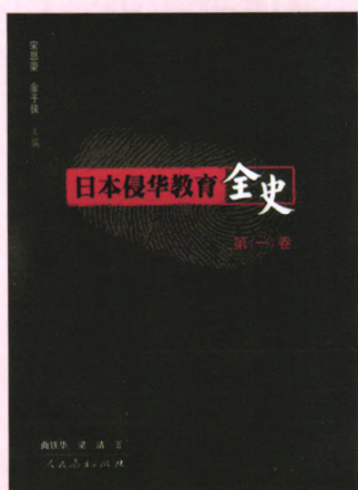
《日本侵华教育全史》中文版 (2005年第1版，2011年第2次印刷)