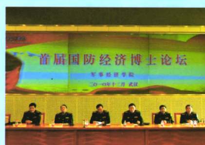
举办国内首届 国防经济博士论坛