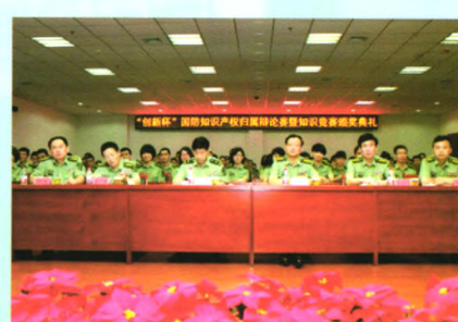
举办国防知识产权竞赛