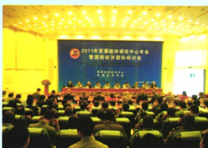
召开国防经济国际研讨会