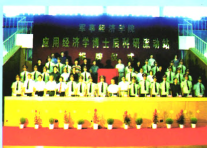
设立全军首个 应用经济学博士后科研流动站