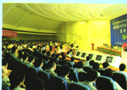
成立国家国民 经济动员业务培训中心