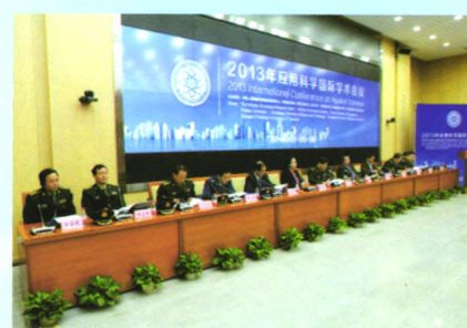
举办应用科学国际学术会议