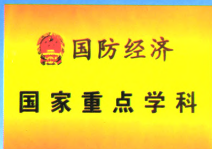
国防经济连续 两次被评为国家重点学科