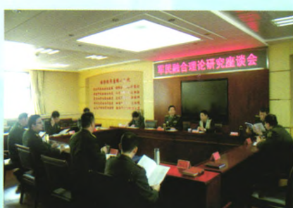
开展军民融合理论研究