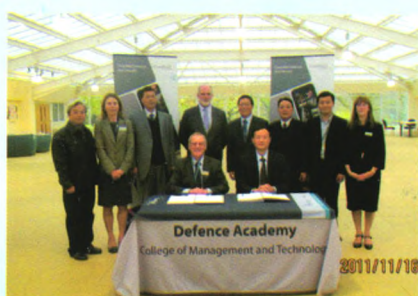
与英国克兰菲尔德大学 国防与安全学院签订合作协议