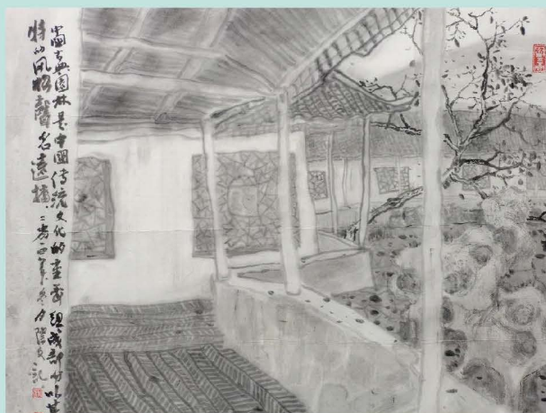
(黎际文, 男, 副教授)