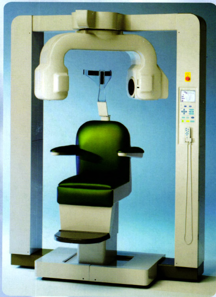
牙科头颈部用小照射野X线CT装置 3DX CT