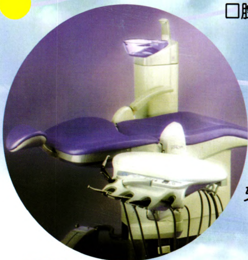
口腔模拟教学评估系统CLINSIM