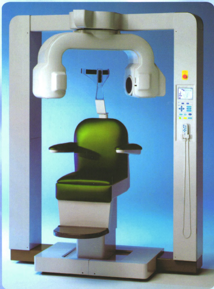
牙科头颈部用小照射野X线CT装置 3DX CT