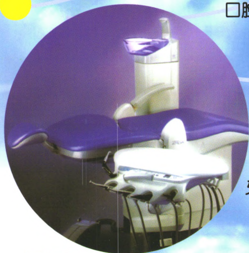
口腔模拟教学评估系统CLINSIM

YUNSHI 上海芸施实业有限公司 江、浙、沪、鄂、皖地区总代理 中国上海市雁荡路107号22楼G座 TEL: 86-21-63874321, 63725886 FAX: 86-21-63723000