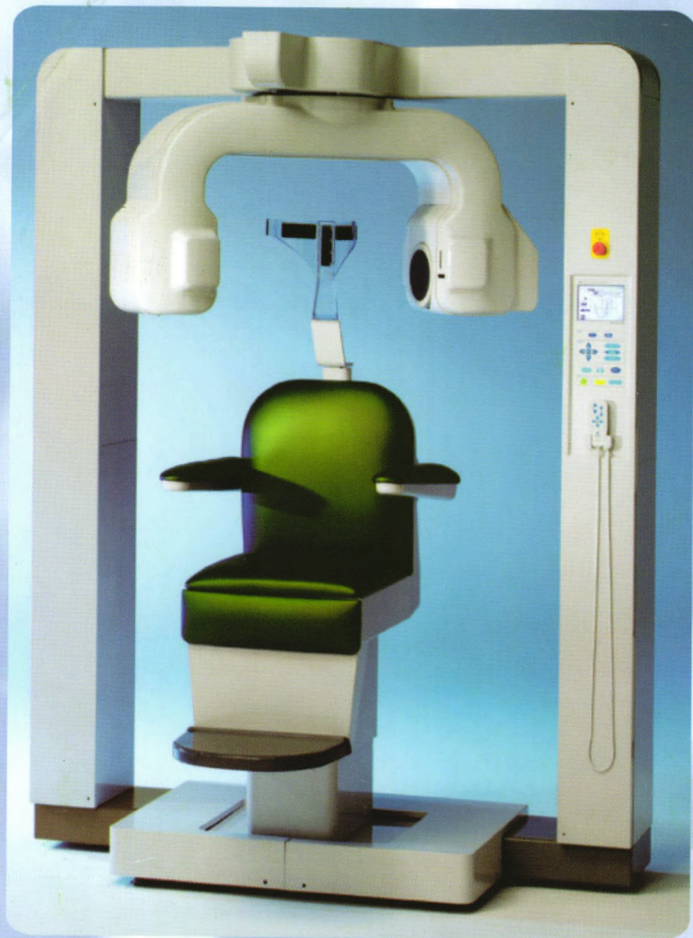
牙科头颈部用小照射野X线CT装置 3DX CT