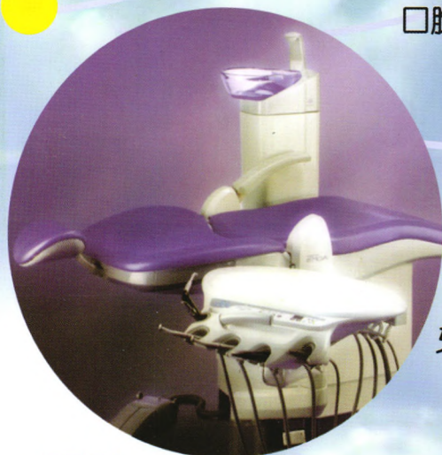
口腔模拟教学评估系统CLINSIM