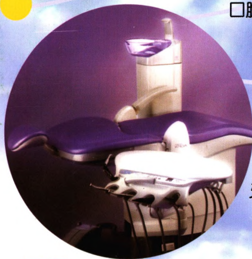
口腔模拟教学评估系统CLINSIM