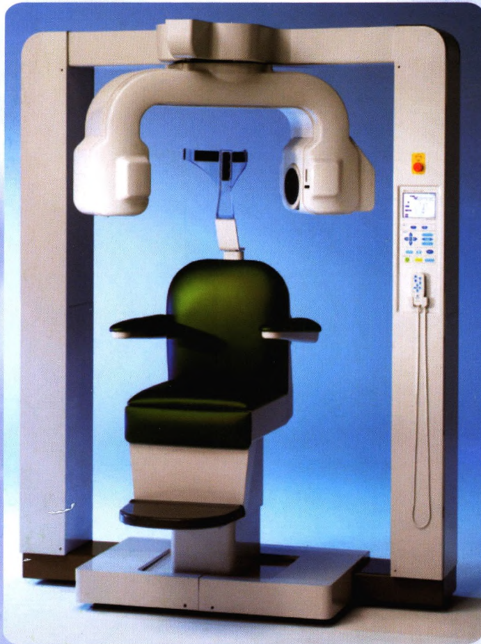
牙科头颈部用小照射野X线CT装置 3DX CT