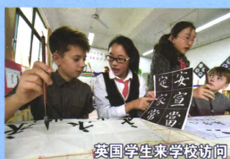
英国学生来学校访问