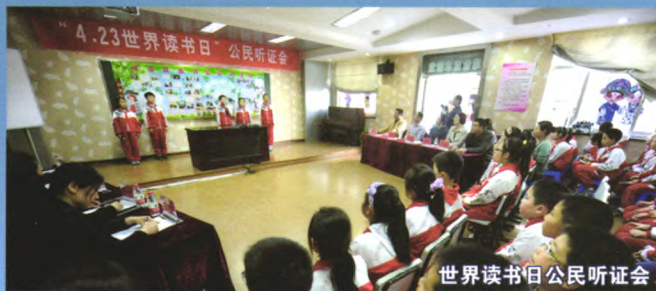
世界读书日公民听证会

公民教育实践活动是一项让学生以公民身份走进社会生活，采用调查、访问、宣传等方式，发现公共生活中的问题，召开公民听证会，促进政府部门改进公民生活的教育活动。这项活动大大激发了孩子关注时事的热情。近年来，2010届11班的同学们就“小学生活动场所不足”问题进行听证展示后，