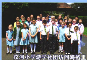
汶河小学游学社团访问海格里