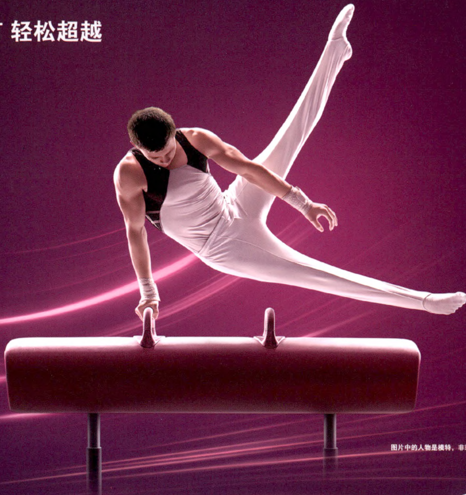
图片中的人物是模特，非现实中患有慢性乙肝或服用韦瑞德。