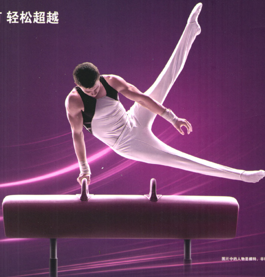
图片中的人物是模特，非现实中患有慢性乙肝或服用韦瑞德。