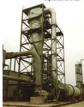
单(三)通道干燥机 Single (three) channel dryer

提供： 年产3-20万立方米木质或非木质刨花板成套设备、年产3-5万立方米水泥刨花板成套设备的设计制造及指导安装和调试。