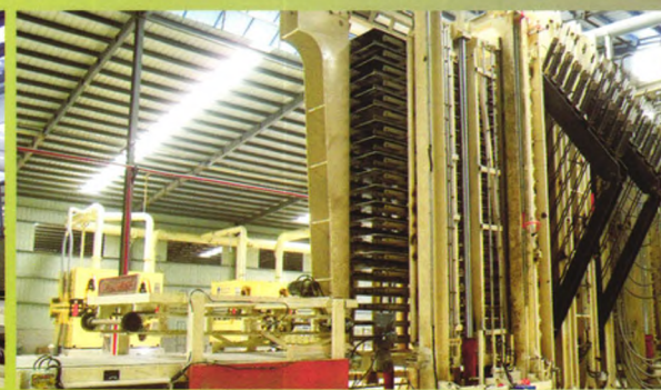
年产3-15万立方米单层热压刨花板生产线

Single-Opening Hotpress PB lines with annual capacities of 30 to 150 thousand cubic meters