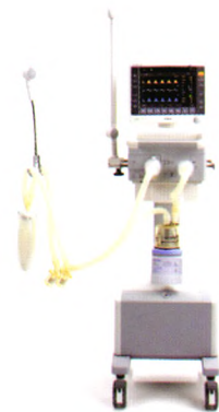
SynoVent E5 呼吸机