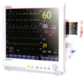
BeneView T8 病人监护仪