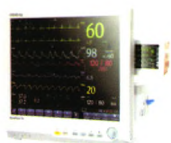
BeneView T8 病人监护仪