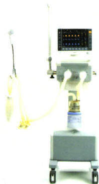
SynoVent E5 呼吸机