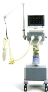
SynoVent E5 呼吸机