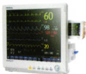
BeneView T8 病人监护仪

迈瑞SynoVent E5呼吸机采用优质的比例电磁阀，精心设计一体化反应主动呼气阀；配合智能的PRVC和Duolevel高级通气模式，为患者提供轻松通气，真正实现人机同步，让患者自由呼吸。