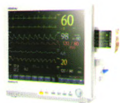
BeneView T8 病人监护仪