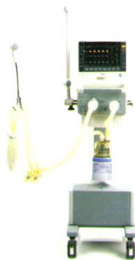
SynoVent E5 呼吸机